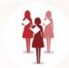
มูลนิธิกลุ่มปราชญ์