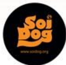
มูลนิธิเพื่อสุนัขในซอย