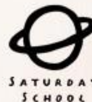
มูลนิธิโรงเรียนวันเสาร์