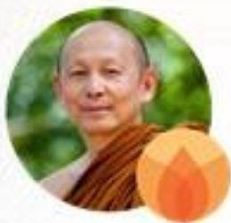
มูลนิธิเครือข่ายพุทธิกา