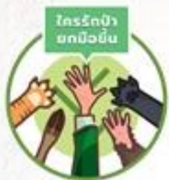
ใครรักป่ายกมือขึ้น