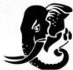
ศูนย์วิจัยช้างและสัตว์ป่า คณะสัตวแพทยศาสตร์ มหาวิทยาลัยเชียงใหม่