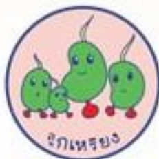
กลุ่มลูกเขียว